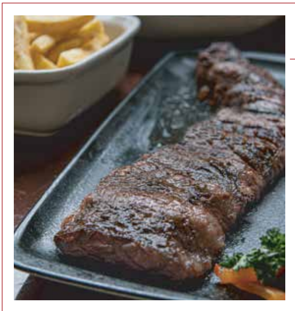
Entraña Fina ANGUS USA