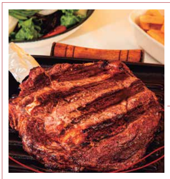
Cowboy Steak ANGUS USA