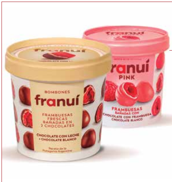
Bombones Franuí | Franuí Pink