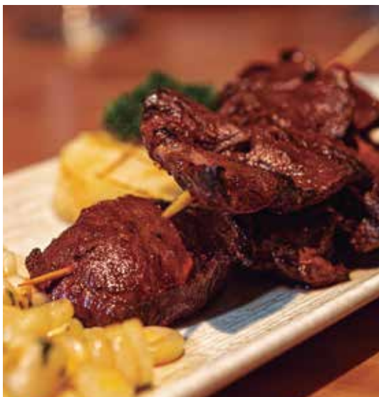
Anticuchos de lomo fino