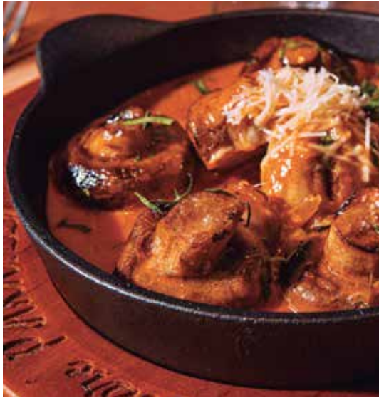
Champiñones al ajillo