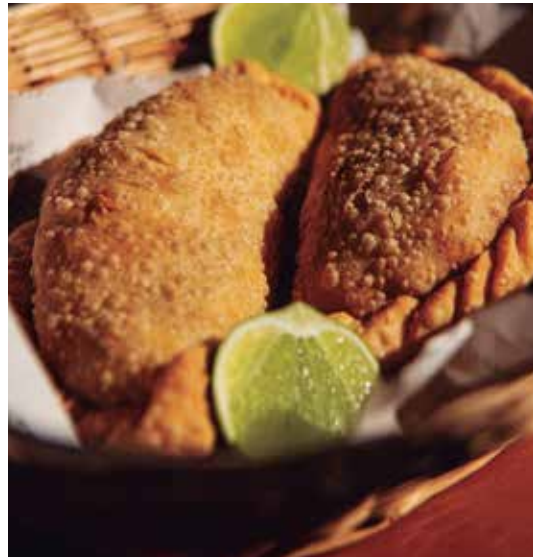
Dos empanadas de carne cortadas a cuchillo