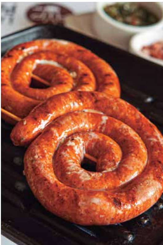
Chistorra Parrillera Artesanal