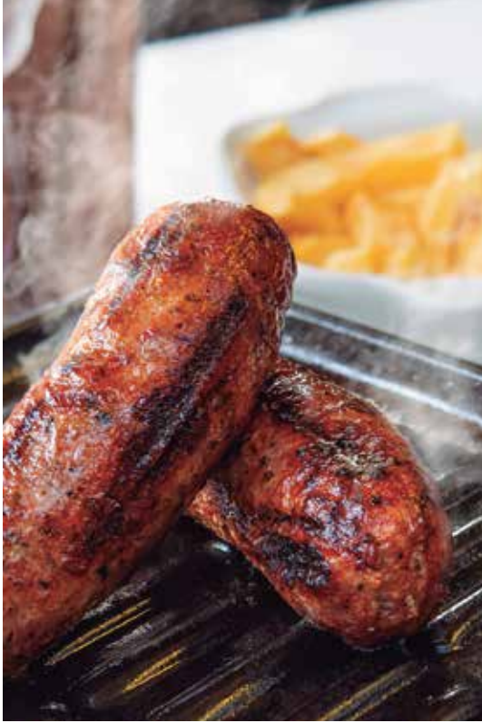
Porción de Chorizos Artesanales